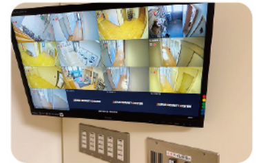
共用スペースは 防犯カメラで24時間見守り