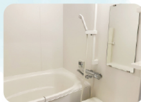
バス (一日の疲れを浴室で)