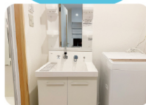
洗面所・洗濯機 (各部屋に用意)