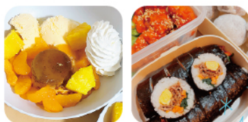
休日に部屋へ集まり、 みんなで作った料理とスイーツ