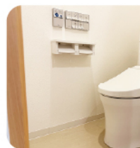
トイレ (浴室と別れて)