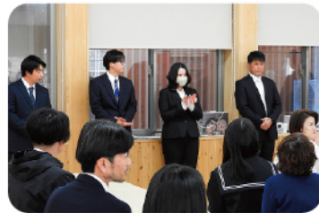
入寮式から新たな生活の スタート

教員や寮スタッフが常駐し、生活や学習に関するサポートも万全。 保護者の方にも安心していただける体制です。